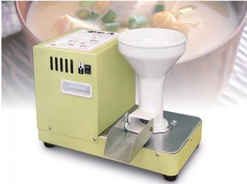
みそすり機 みそいち MS-250

●所要動力:100V/250W ●能率:みそ15kg/約30分 ●寸法(幅×長×高):365×235×296mm ●質量:13kg 希望小売価格 74,800円 (税別)