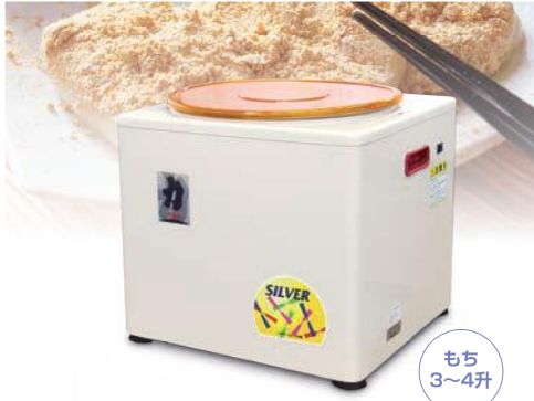
餅つき機 力(ちから) NK-402

●所要動力:100V/250W ●能率:もち4升/約8~10分 ●寸法(幅×長×高):430×400×395mm ●質量:16.5kg 希望小売価格 79,800円 (税別)